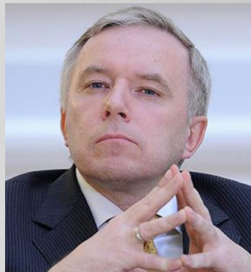
Председатель Общественного Совета